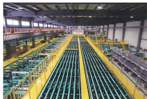
提供:三ヶ日農業協同組合