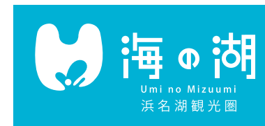
A-2 横バージョン(白抜き・浜名湖観光圏入)